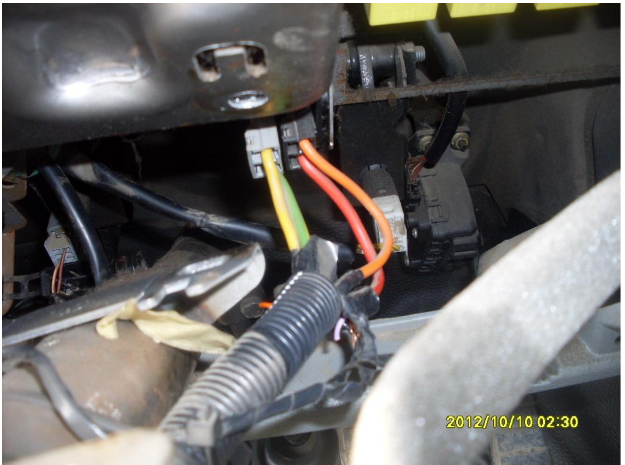
Замок заж. Красный +, Оранже.-стартер, Желтый- зажиган, Желто-зеленый- АСС.