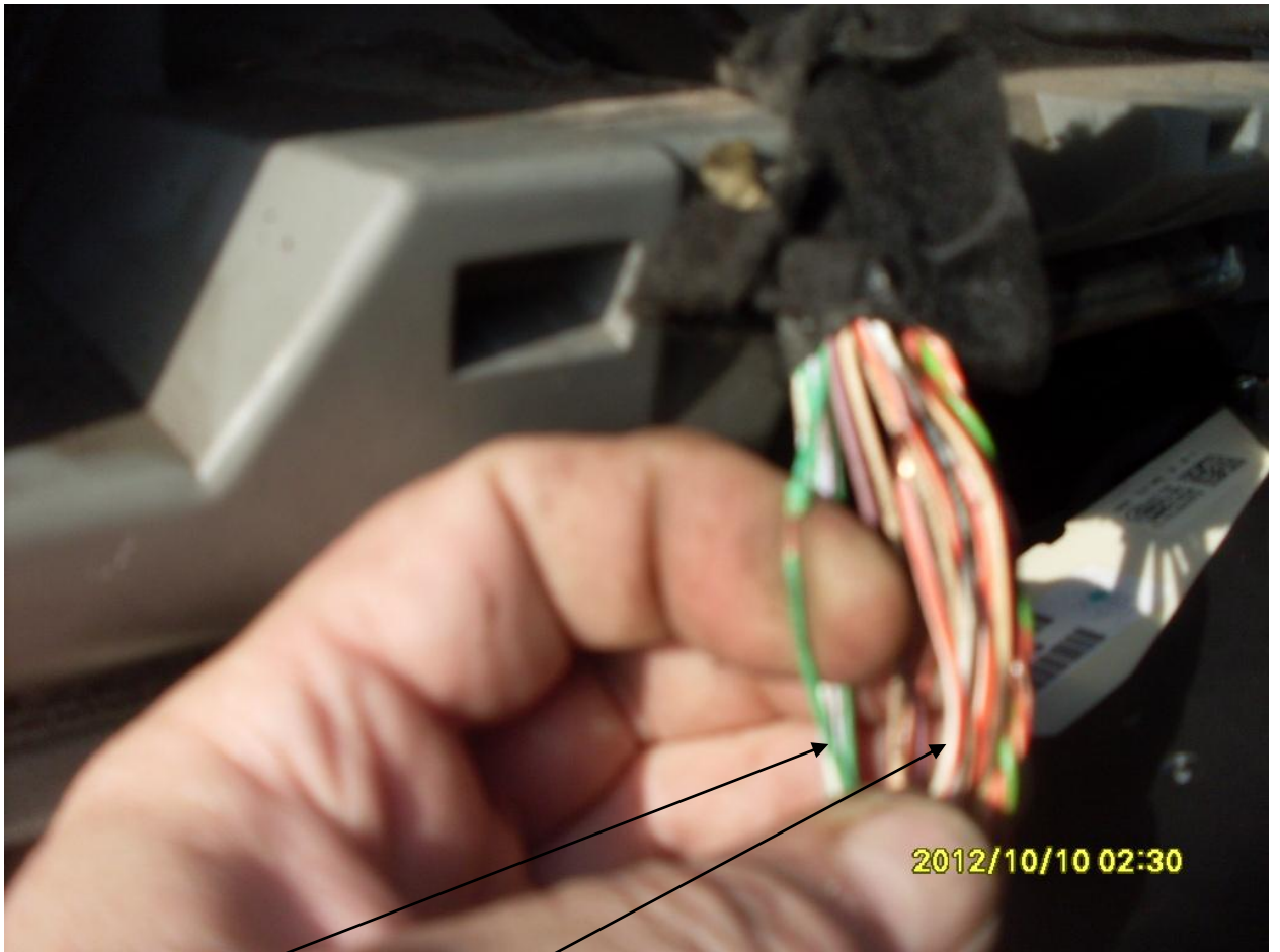
Генератор зеленый, ручник –бело-красный.